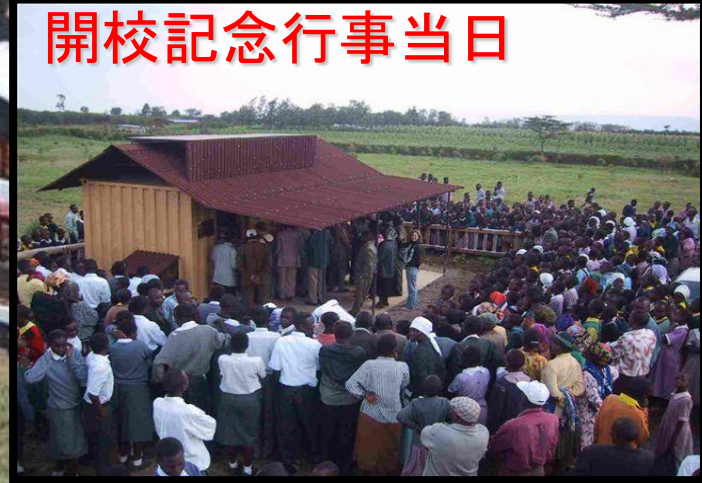
開校記念行事当日