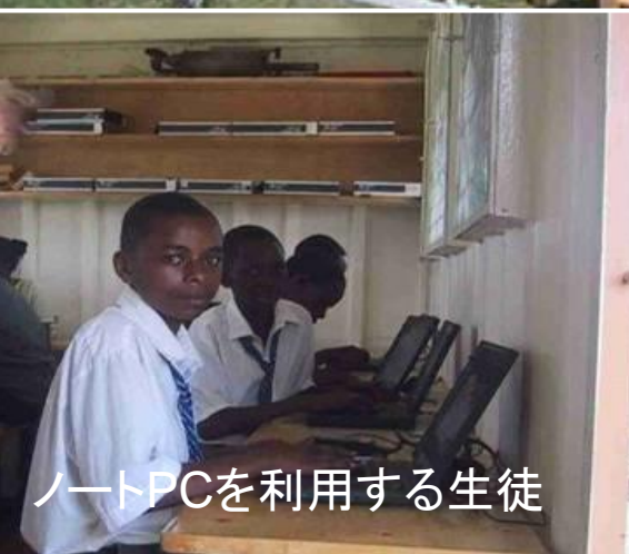
ノートPCを利用する生徒